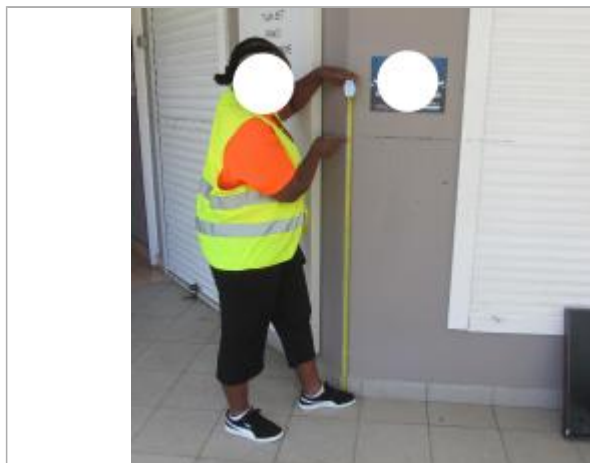
Dépôt de matières solides