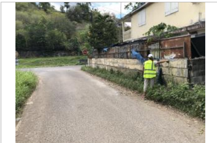
Mur de clôture