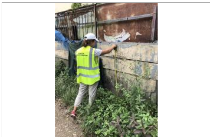
Niveau mesuré depuis le sol

Altitude calculée de l'eau (en m) : 14.7