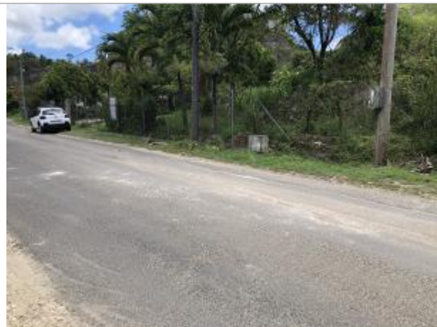
Dépôts sur le grillage à proximité de la route