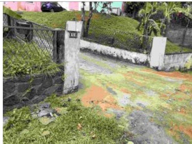
1010 route des petites Abymes

Coordonnées WGS84 : X: -61.50469000 / Y: 16.23548790