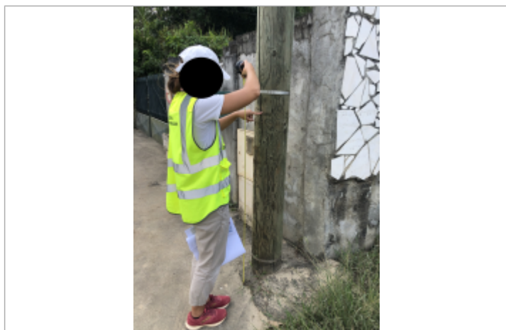
Dépôts de matières solides sur le poteau électrique

Altitude calculée de l'eau (en m) : 7.6 m