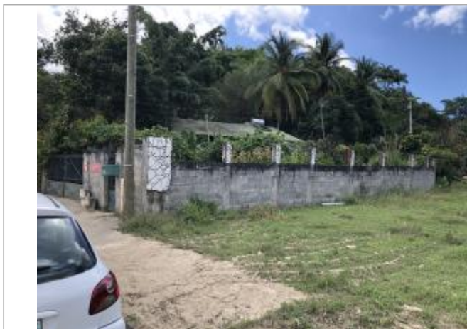
Dépôts sur le poteau électrique proche d'une habitation