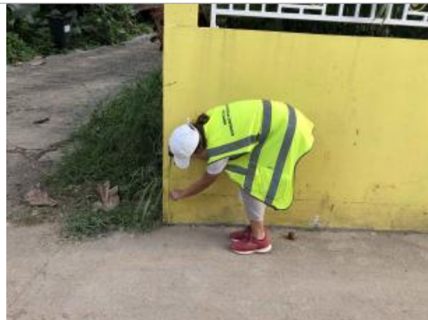
Route de Besson (en face de l'imp Leon Petit)