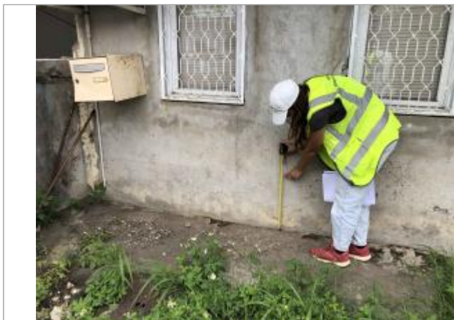
Raizet / Allée Bagatelle

Coordonnées WGS84 : X: -61.53031700 / Y: 16.25773280