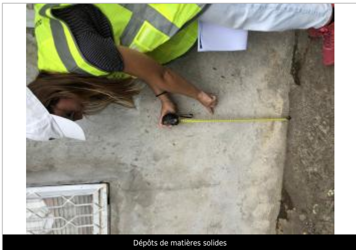
Dépôts de matières solides