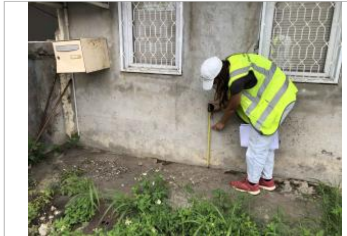
Raizet / Allée Bagatelle

Coordonnées WGS84 : X: -61.53031700 / Y: 16.25773280