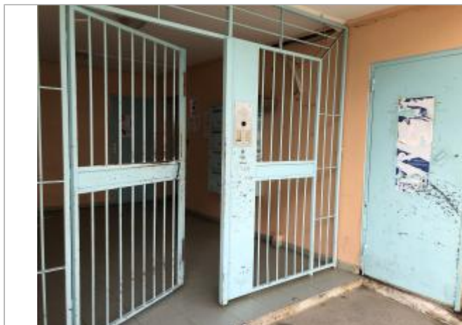
Mur orange à l'entrée du bâtiment

Coordonnées WGS84 : X: -61.51990800 / Y: 16.25710900