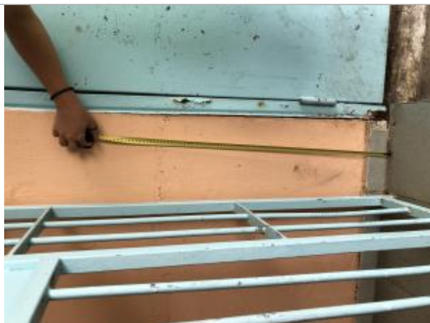
Dépôts de matières solides

Altitude calculée de l'eau (en m) : 6.55 m