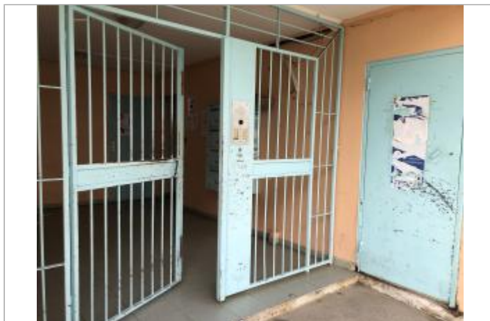
Mur orange à l'entrée du bâtiment