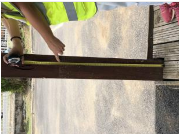
dépôts de matières solides

Altitude calculée de l'eau (en m) : 6.38