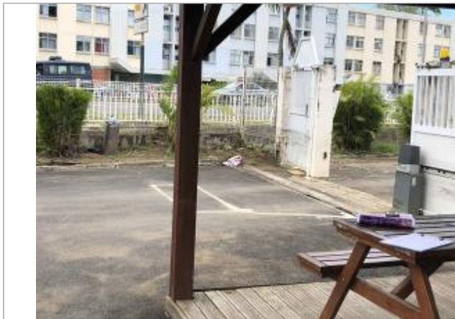
Av Pat St Eloi / Association ACCORS a coté marché AN NOU

Coordonnées WGS84 : X: -61.52033700 / Y: 16.25742690