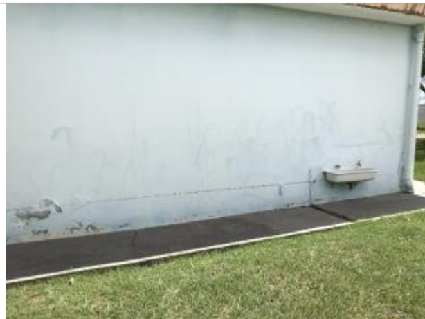
Façade extérieure du bâtiment dans la cour