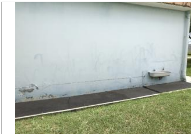
Façade extérieure du bâtiment dans la cour

Coordonnées WGS84 : X: -61.52910200 / Y: 16.25934200