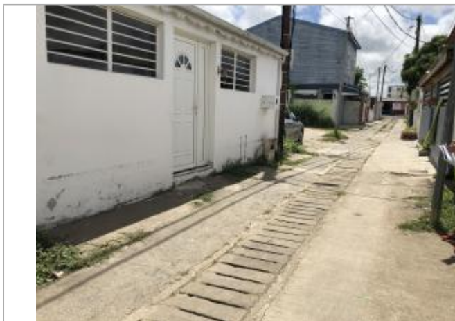
Façade extérieure maison côté rue