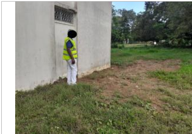
Porte blanche façade extérieure du bâtiment