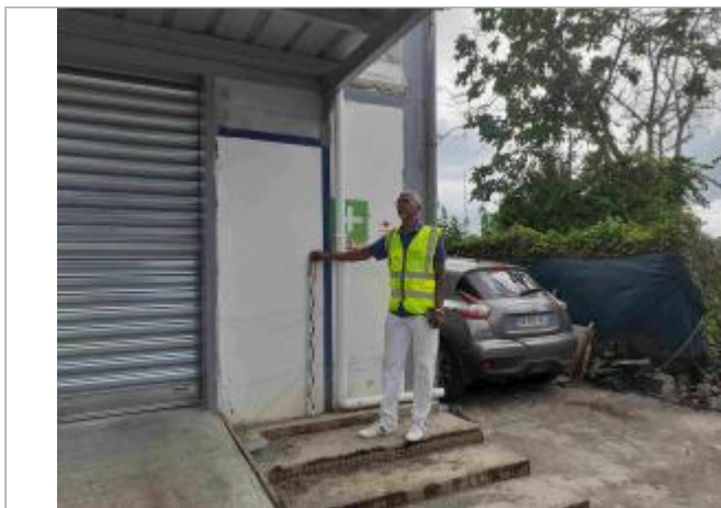
Canal usine de produits chimiques / Parking