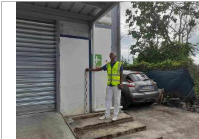
Canal usine de produits chimiques / Parking