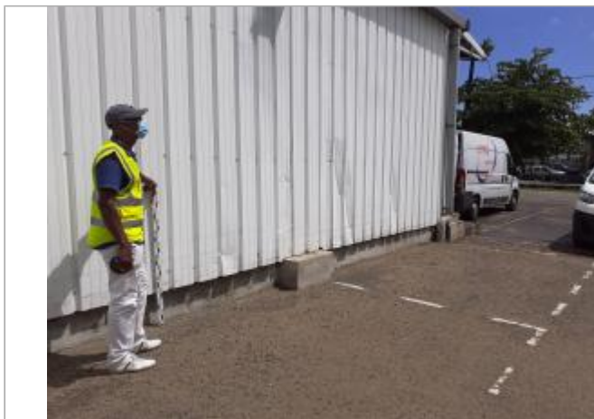
Mur blanc façade en tôle sur parking