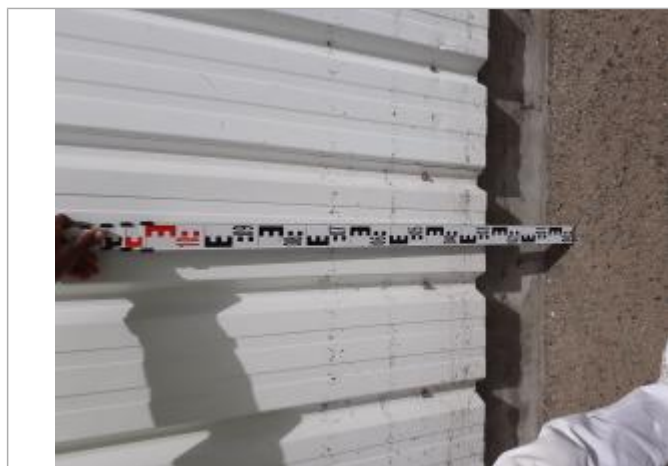
Dépôts de matières solides

Altitude calculée de l'eau (en m) : 3.68