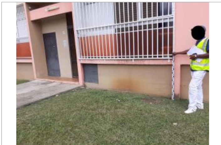
Mur façade extérieure