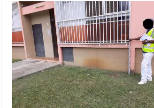
Mur façade extérieure

Coordonnées WGS84 : X: -61.52421900 / Y: 16.25232200