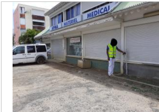
Façade bâtiment médical