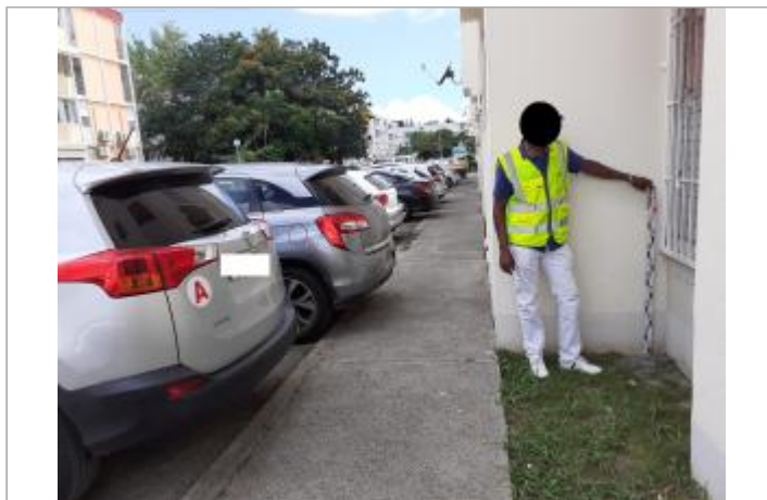
Renforcement bâtiment côté rue