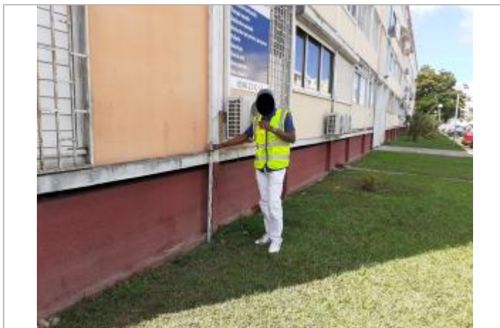
Mur bordeau façade extérieure