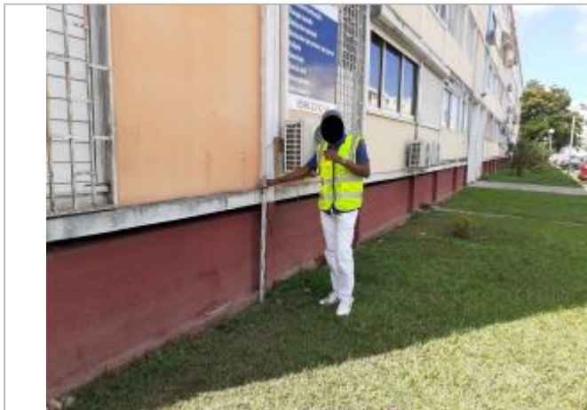
Mur bordeaux façade extérieure

Coordonnées WGS84 : X: -61.52237300 / Y: 16.25269200