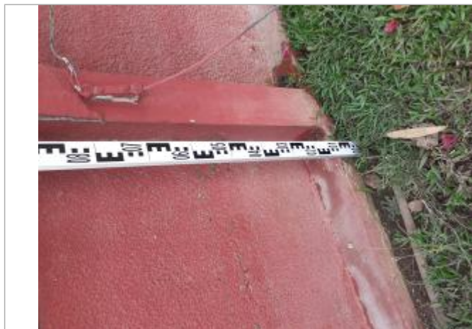
Dépôts de matières solides

Altitude calculée de l'eau (en m) : 4.15 m