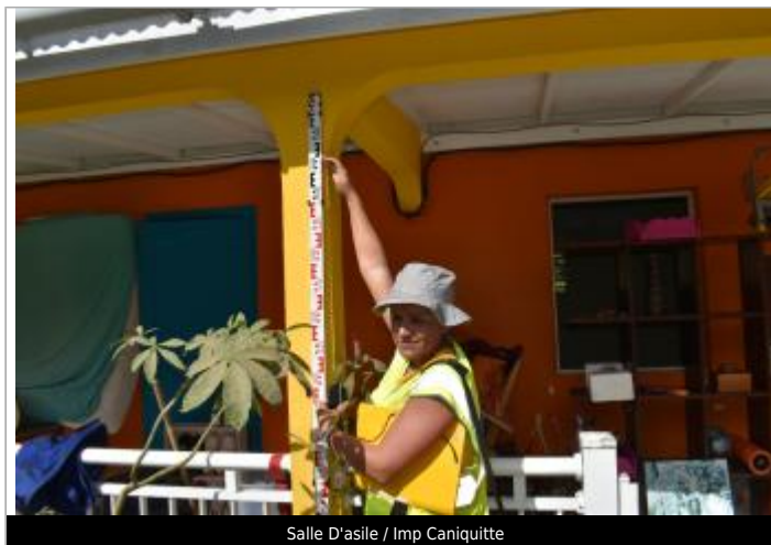
Salle D'asile / Imp Caniquitte

Coordonnées WGS84 : X: -61.50071800 / Y: 16.25999700