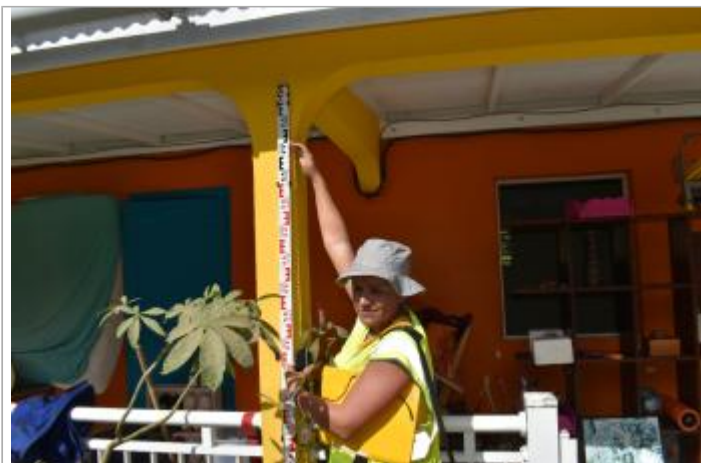
Salle D'asile / Imp Caniquitte