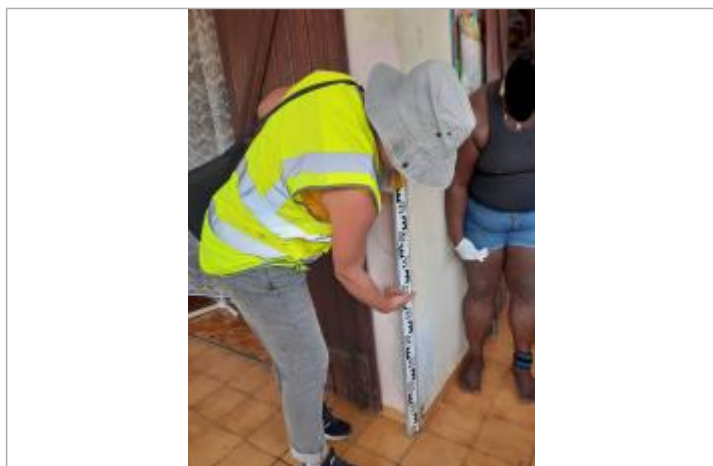
Témoignage hauteur d'eau

Altitude calculée de l'eau (en m) : 13.77 m