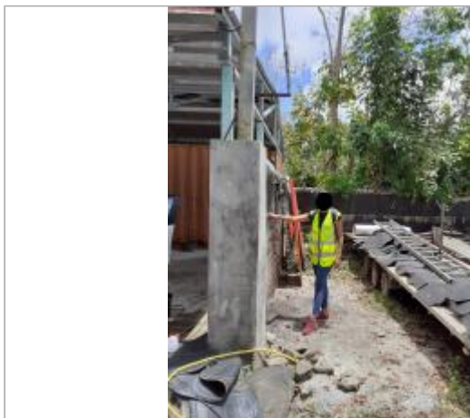
Mur façade extérieure

Coordonnées RGF93 (ETRS89) : X: -61.52221 / Y: 16.25755