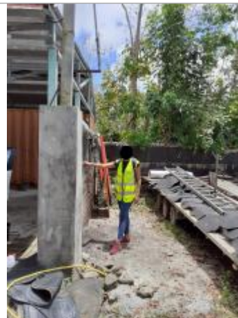
Mur façade extérieure

Coordonnées RGF93 (ETRS89) : X: -61.52221 / Y: 16.25755