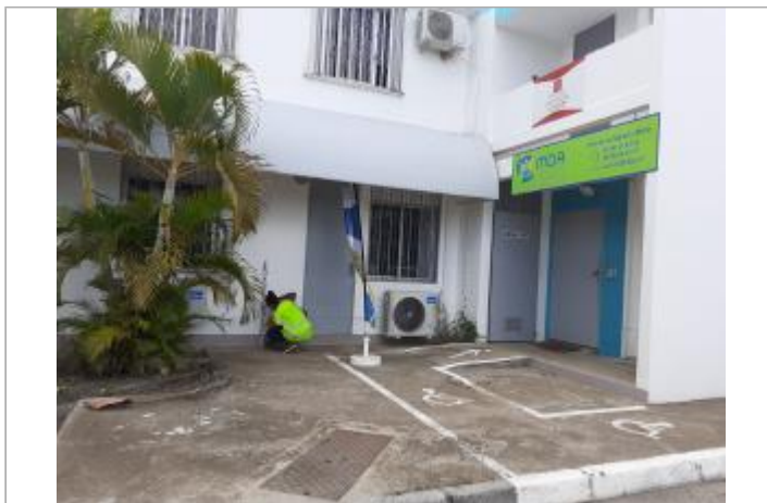
Façade extérieure du bâtiment