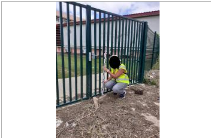
Portail côté extérieur