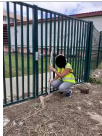
Portail côté extérieur

Coordonnées RGF93 (ETRS89) : X: -61.519656 / Y: 16.2587401