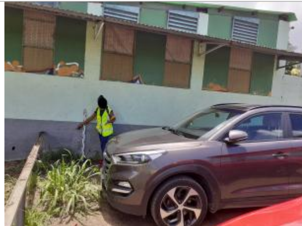
Maison individuelle mur vert/bleu façade extérieure