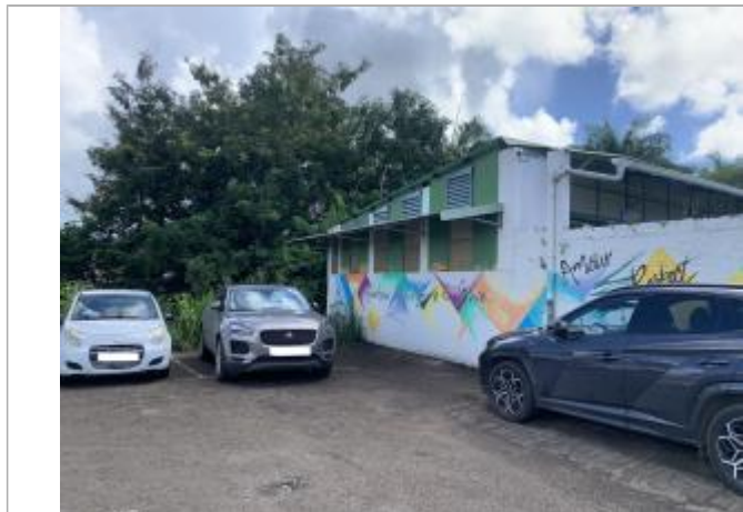
Vue depuis le parking vers le canal

Différence entre le niveau d'eau et la référence (en m) : 0.410 m