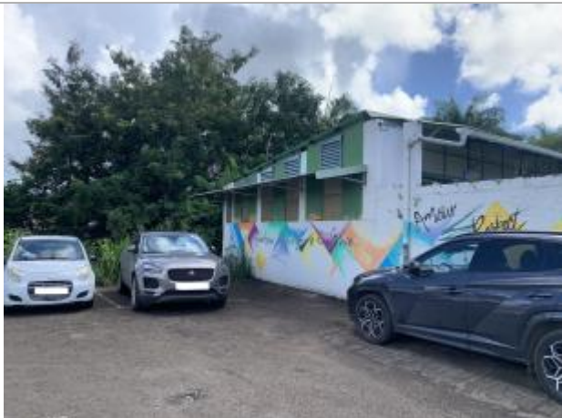
Vue depuis le parking vers le canal

Différence entre le niveau d'eau et la référence (en m) : 0.410 m