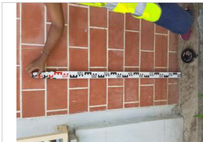
dépôts de matières solides