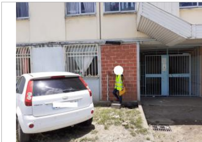
Mur façon brique façade extérieure

Coordonnées RGF93 (ETRS89) : X: -61.520331 / Y: 16.256685