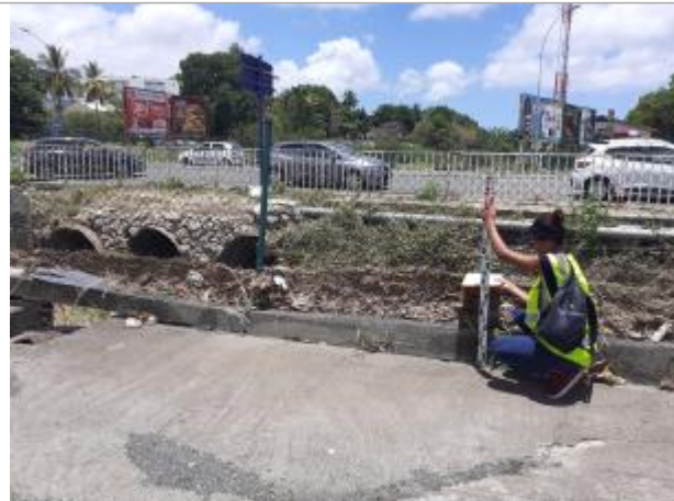
Grillage à l'aval de canal