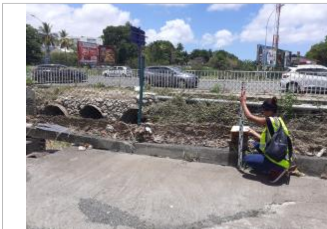
Grillage à l'aval de canal