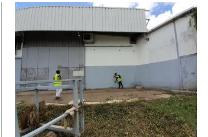
Mur bleu façade extérieure