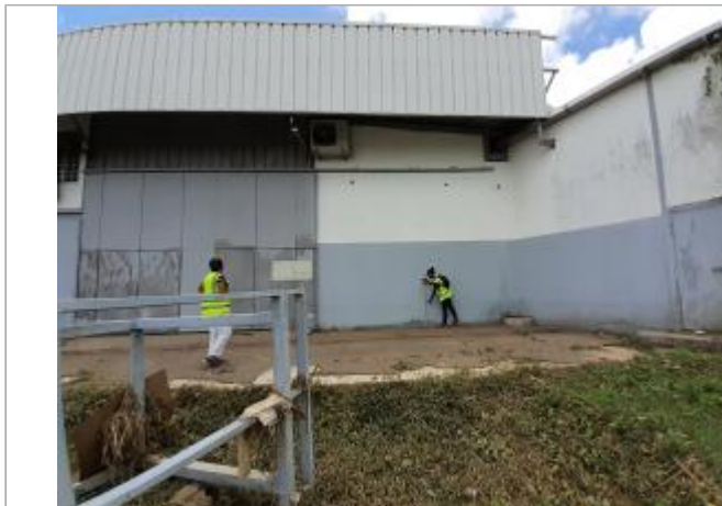
Mur bleu façade extérieure