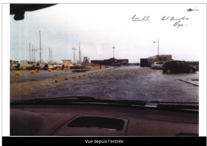
Vue depuis l'entrée

MARQUE Maximum de l'inondation : Non renseigné Visibilité : Oui