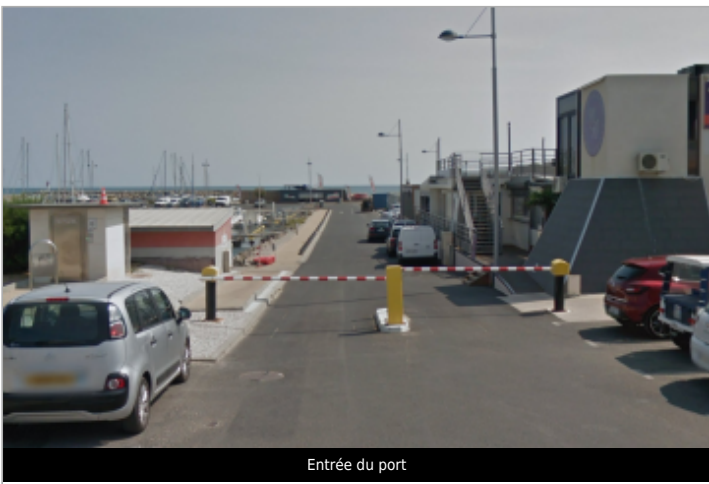
Entrée du port

GÉOLOCALISATION Coordonnées WGS84 : X: 3.55626050 / Y: 43.31727300 Coordonnées RGF93 (Lambert 93) X: 745149.68 / Y: 6246616.3 Coordonnées RGF93 (ETRS89) : X: 3.5562605 / Y: 43.317273 Code Hydro: _MERMEDI Rive de référence: