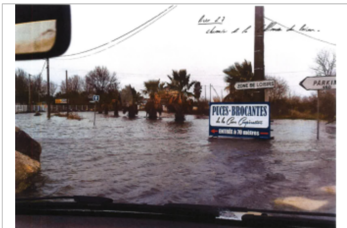
Entrée du chemin vers le karting