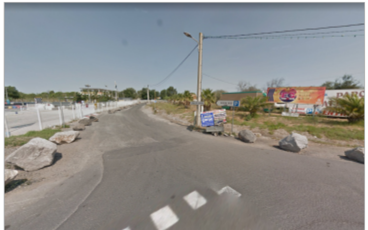
Entrée du chemin

Coordonnées WGS84 : X: 3.54552780 / Y: 43.32120000