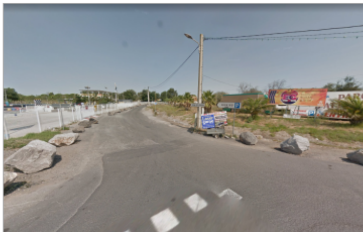
Entrée du chemin