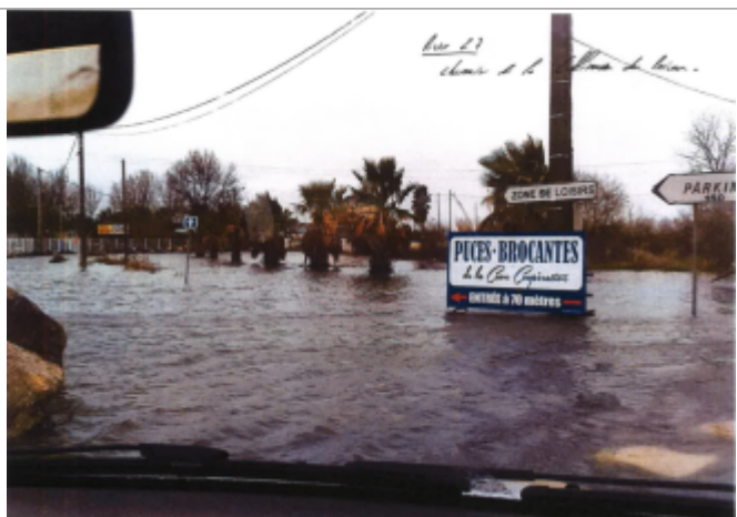
Entrée du chemin vers le karting