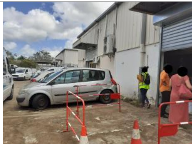
Entrée entrepot mur façade côté parking