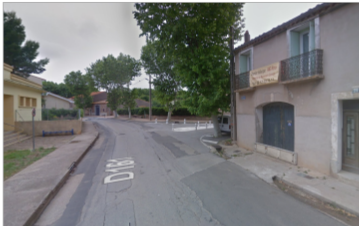
Vue depuis le haut du boulevard Voltaire