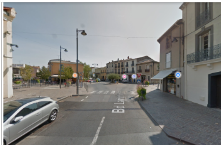
Vue du boulevard depuis la partie haute