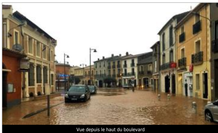
Vue depuis le haut du boulevard