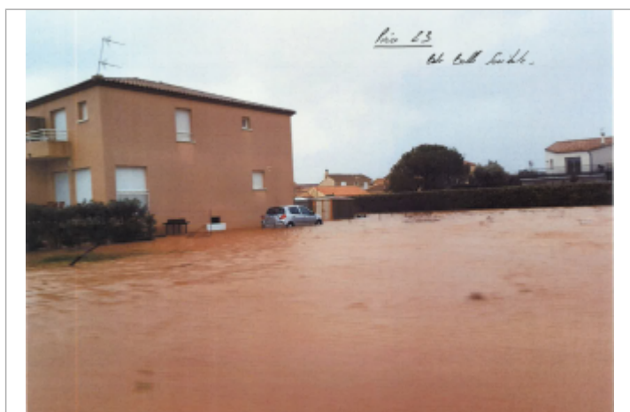
Vue de la maison au n°2

Altitude calculée de l'eau (en m) : 1.3 m