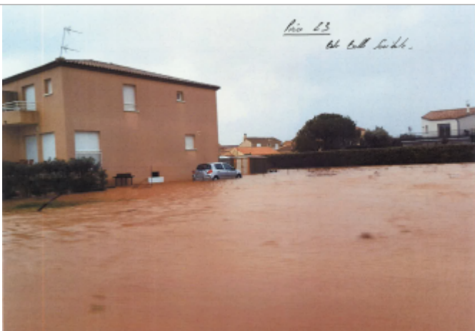
Vue de la maison au n°2

Altitude calculée de l'eau (en m) : 1.3 m