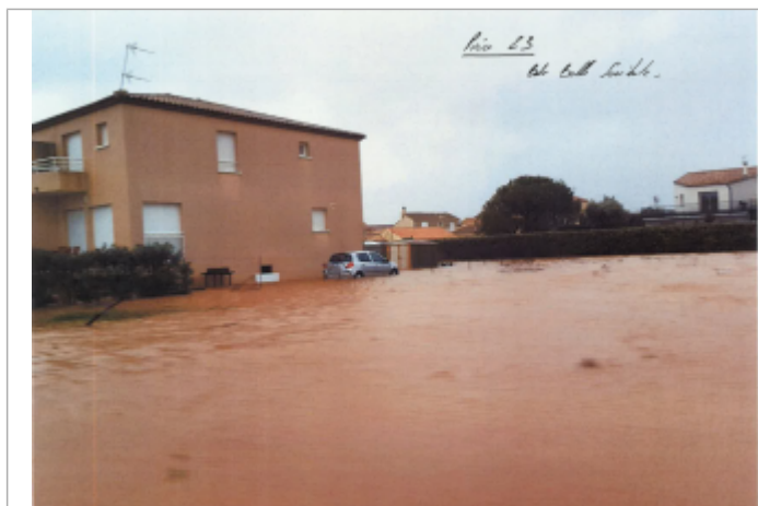
Vue de la maison au n°2

Altitude calculée de l'eau (en m) : 1.3 m