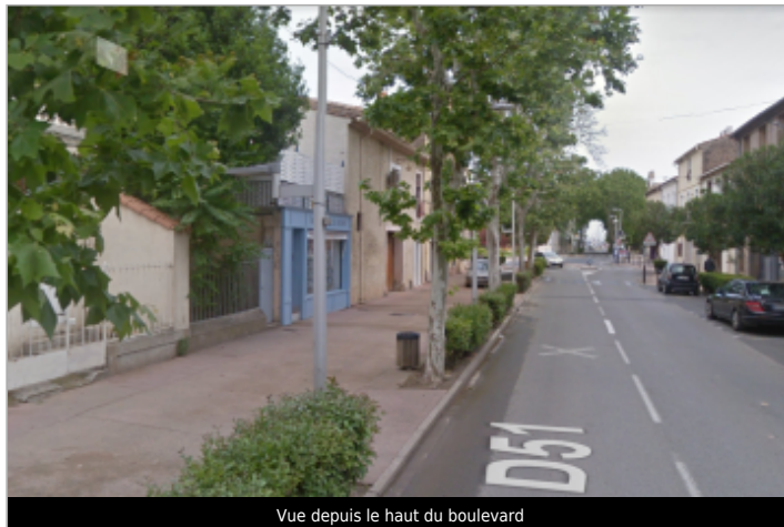
Vue depuis le haut du boulevard