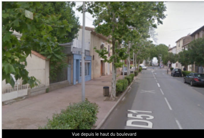
Vue depuis le haut du boulevard