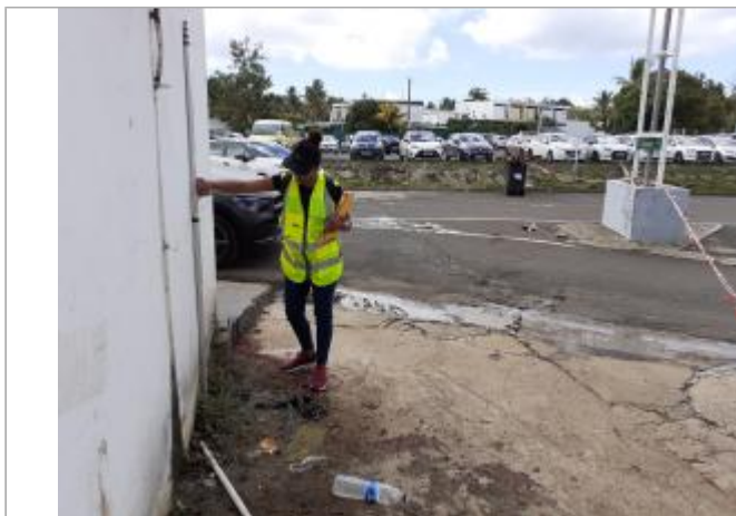
Mur blanc façade extérieure