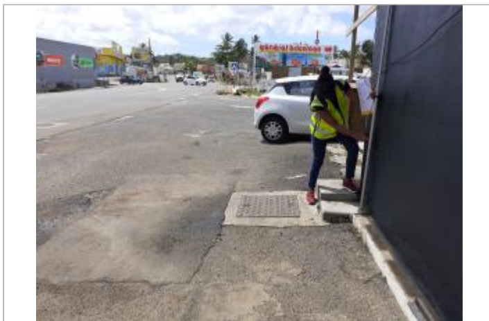
Mur noir extérieur à proximité du magasin de bricolage