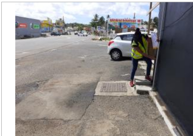
Mur noir extérieur à proximité du magasin de bricolage