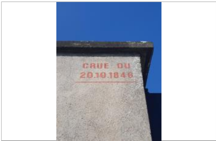
Photo rapprochée du repère, en mai 2022

MARQUE Texte : CRUE DU 20.10.1846 Maximum de l'inondation : Oui Visibilité : Oui État du repère : Bon Pérennité : Longue