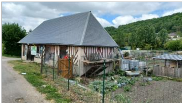
Mur du bâtiment en torchis dans "les jardins ouvriers de la Cartonnerie", Quai Maritime.