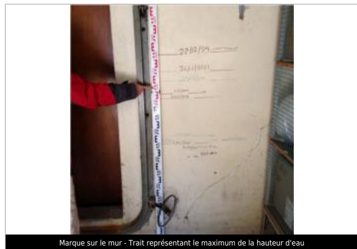
Marque sur le mur - Trait représentant le maximum de la hauteur d'eau

MARQUE Visibilité : Non État du repère : Moyen Pérennité : Moyenne Repère calculé : Non PHEC : Non