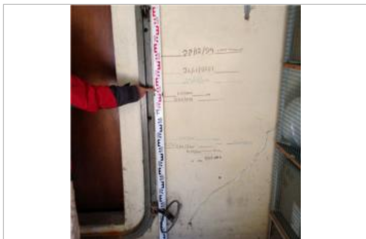
Marque sur le mur - Trait représentant le maximum de la hauteur d'eau

Altitude calculée de l'eau (en m) : 34.758 m