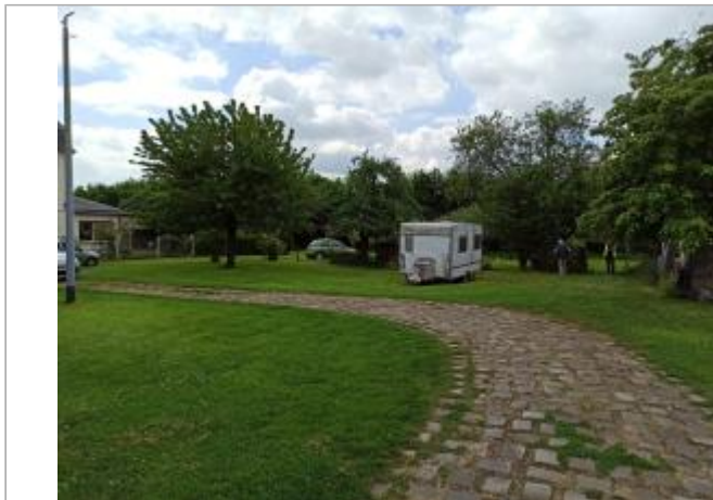
Sol herbeux dans jardin au 40 Quai de La Ruelle