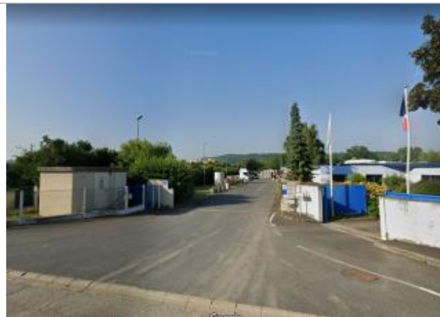
Sol de la route bitumée dans l'usine de construction de structure en béton au 42 Quai de la Ruelle