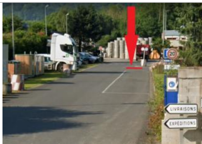
Laisse de crue sur la route

Altitude calculée de l'eau (en m) : 4.96 m