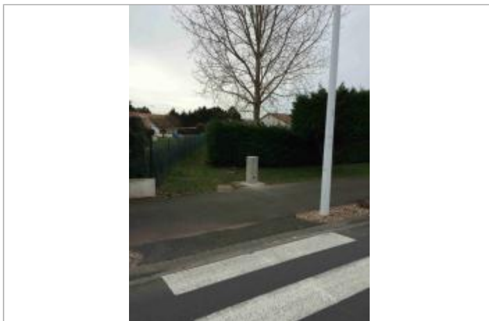
Point de vue du site