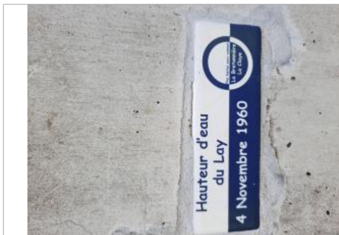
Repère de la crue du 4 novembre 1960