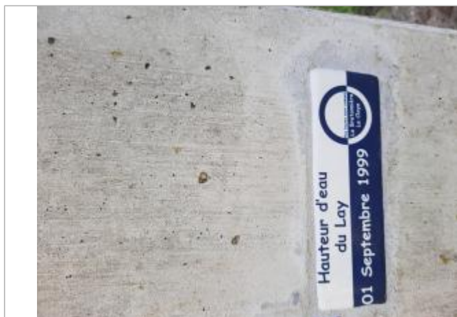
Repère de la crue du 1er septembre 1999