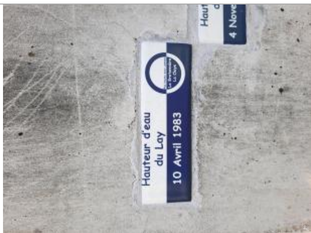
Repère de la crue du 10 avril 1983

Altitude calculée de l'eau (en m) : 6.34